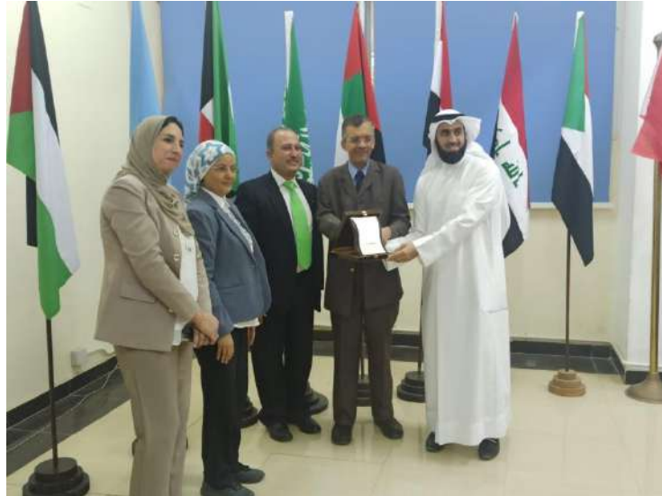
أ.د. عبد الرحمن الرجعان الملحق الثقافي لسفارة دولة الكويت