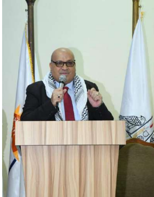
د. سليم التالولى مسئول الجامعات والانشطة الطلابية بسفارة فلسطين