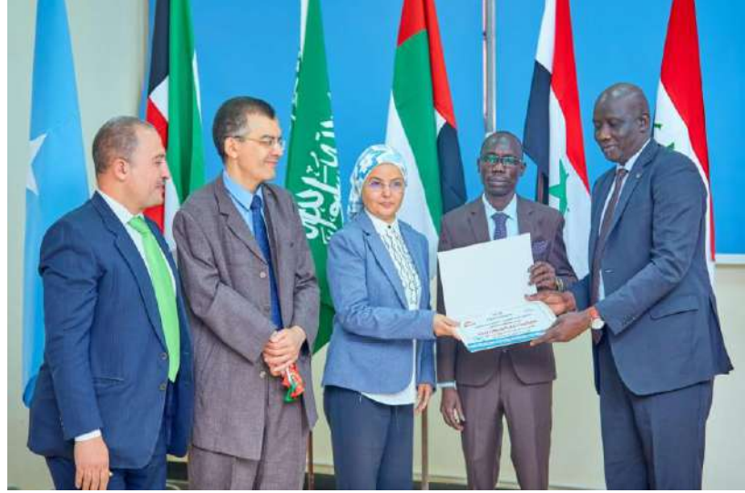
د. جوزيف ماجاك سفير دولة جنوب السودان في مصر