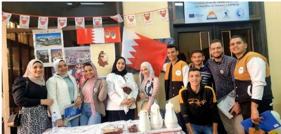
مشاركة الطلاب فى يوم تكريم الوافد