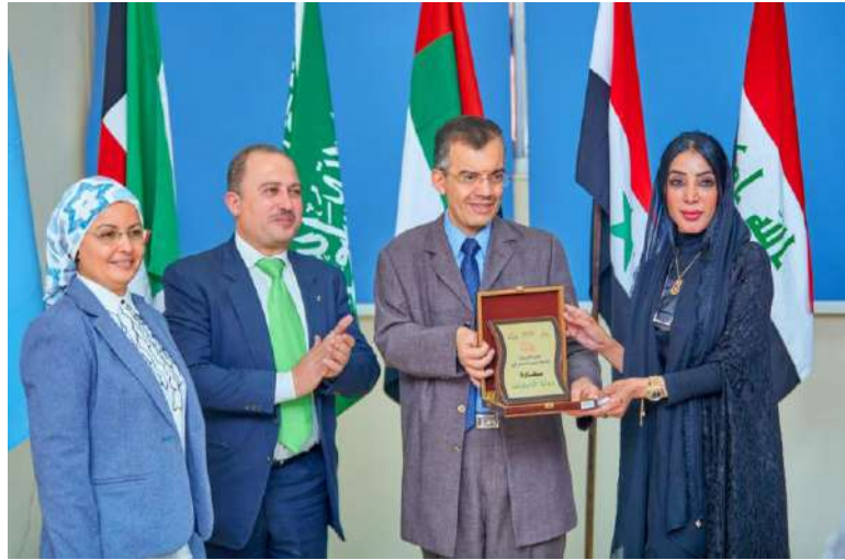
د إيمان الحوسنى الملحق الفنى والثقافى لدولة الإمارات العربية