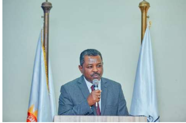
أ.د مرتضى على عثمان الملحق الثقافي السودانى