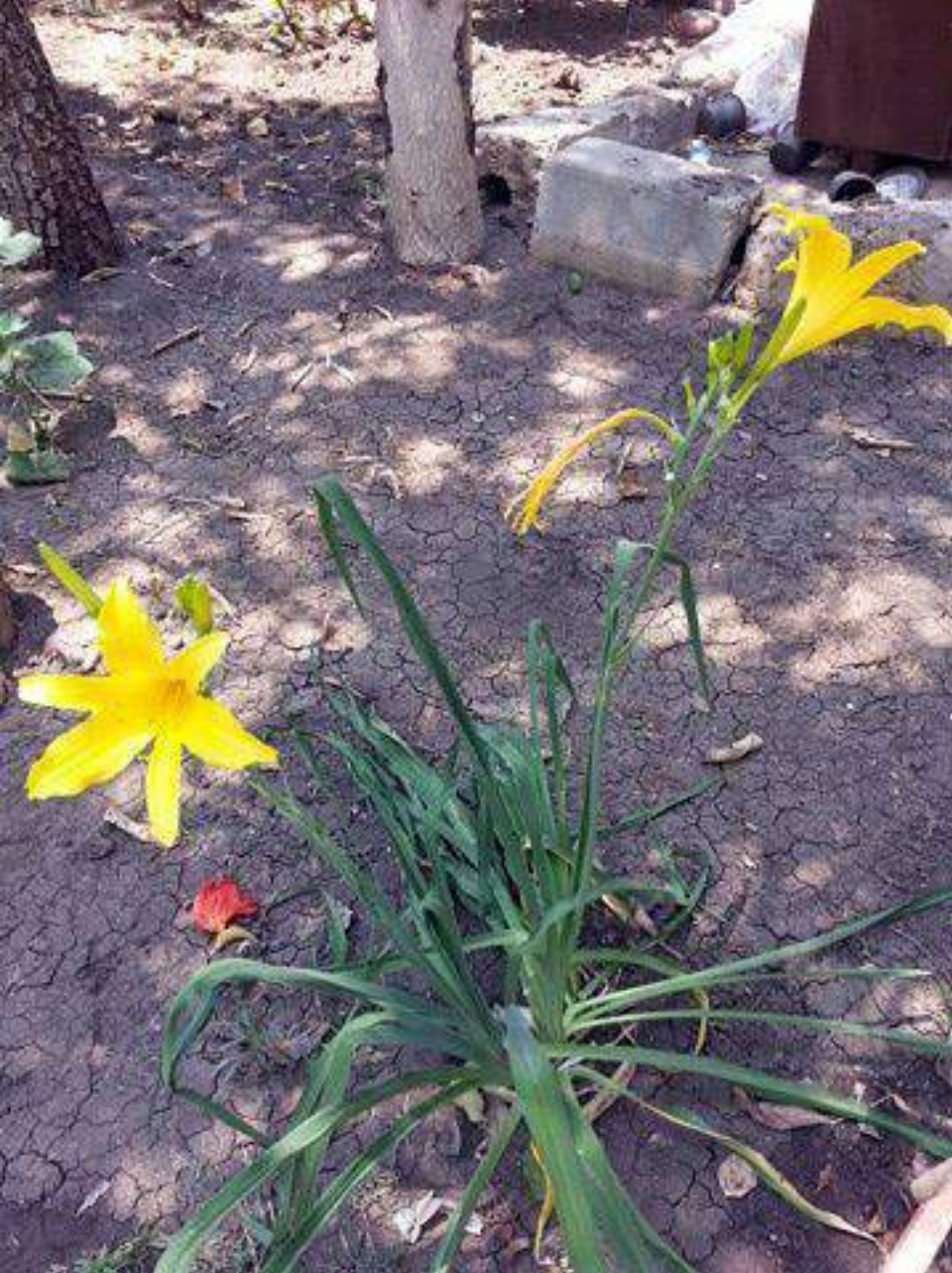
Hemerocallis Family Liliaceae