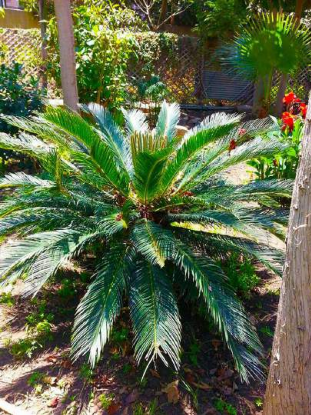
Cycas revoluta [Cycadaceae]