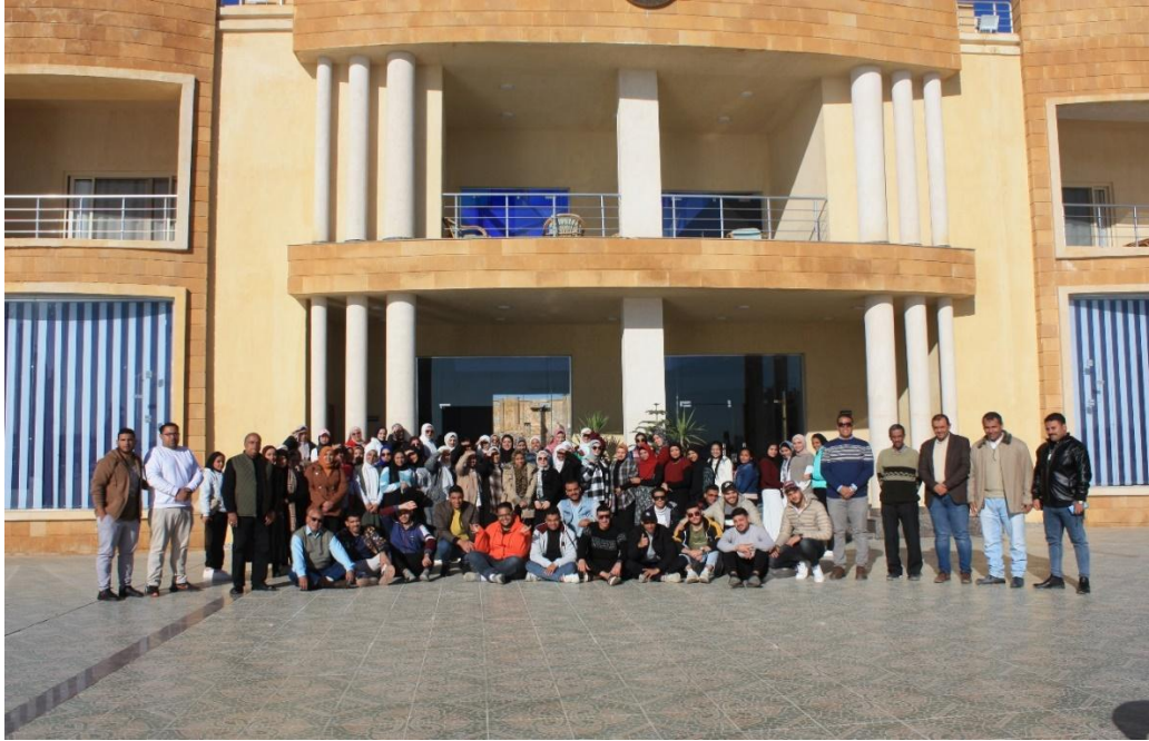
دفعة 2024 في دار الدفاع الجوي بمطروح الدراسة الميدانية