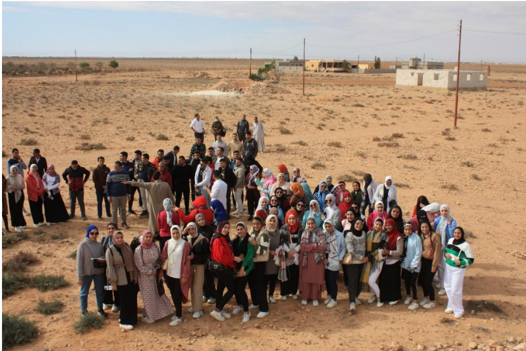
دفعة 2024 هضبة الدفة الدراسة الميدانية مرسى مطروح