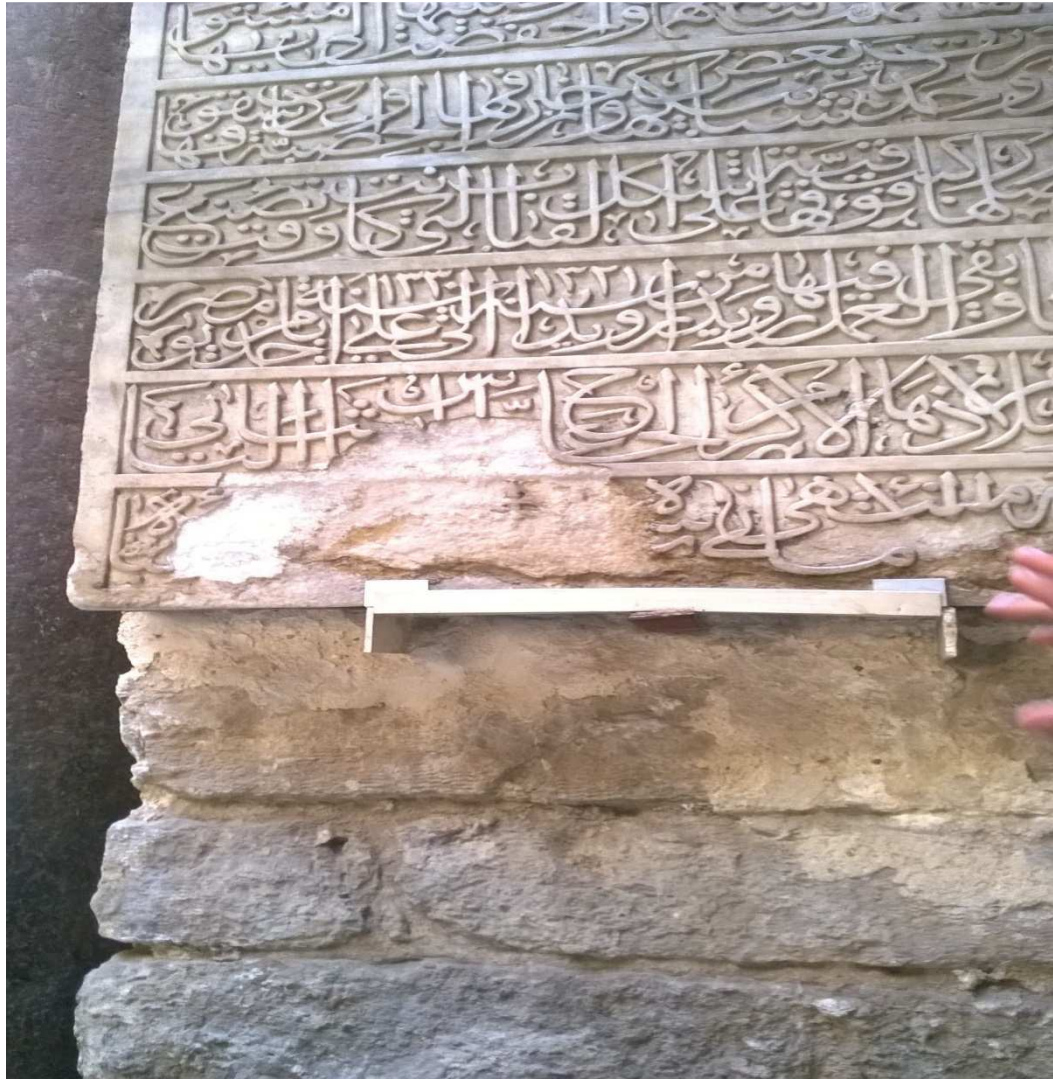
توضح هذه الصورة تآكل النقوش على هذا اللوح الحجري وذلك نتيجة لحدوث التجوية